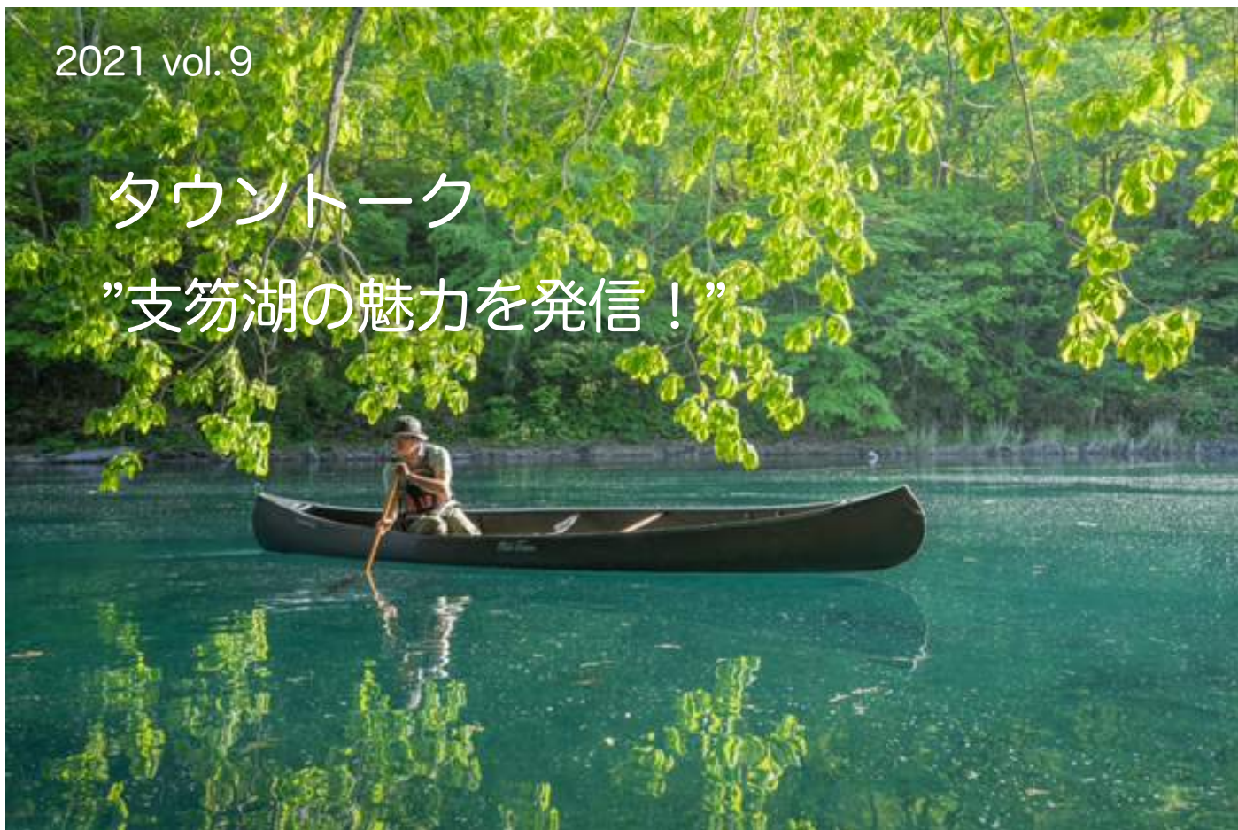
写真 支笏湖夏のカヌー（2021）